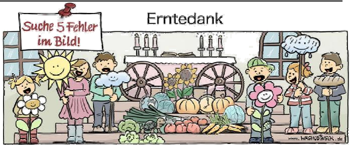
Globus, Schmirke, Bielefeld, Uhr, Fisch

Jedes Jahr feiern wir von Ende September bis Mitte Oktober Erntedankfeste.